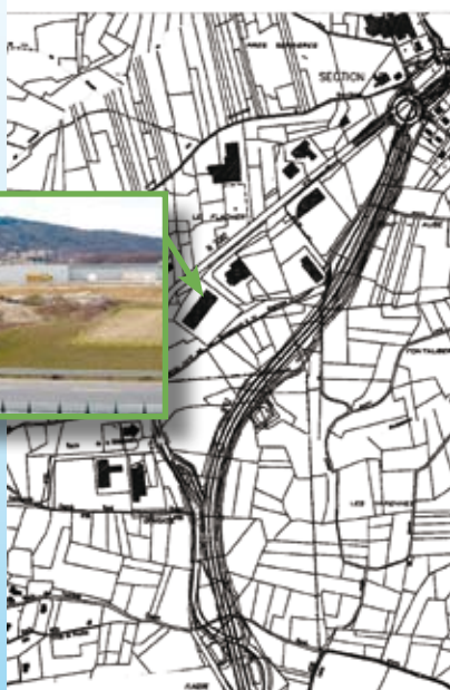
Zone de Félines/Peaugres