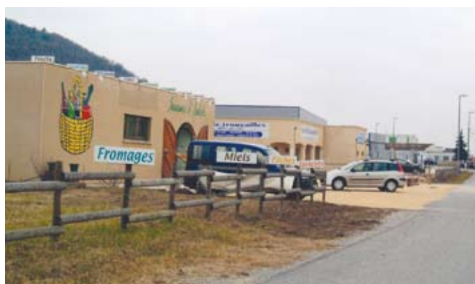
Schéma d'accueil des activités économiques

Certaines ont même investi dans de nouveaux bâtiments pour renforcer leurs capacités de production.